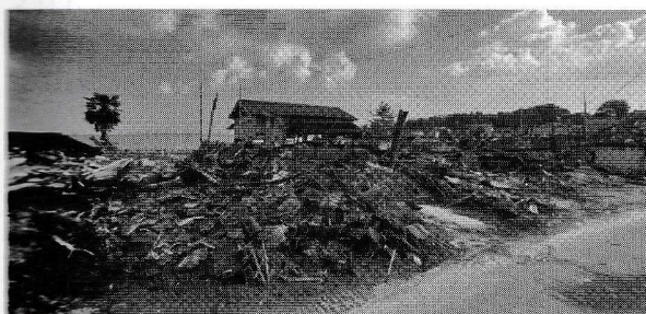
[写真2] 能登町白丸地区(津波浸水 & 火災焼失) 2024年3月14日撮影