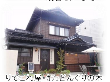
りでこれ屋・カフェとんぐりの木