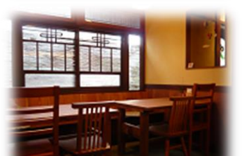
りでこれ屋・カフェとんぐりの木